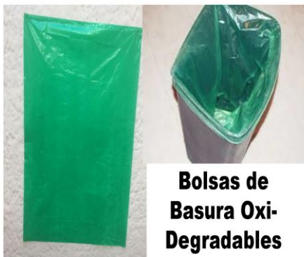
Bolsas de Basura Oxi- Degradables